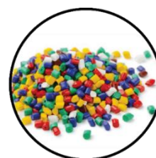
PPS 3 Materiais POLIMÉRICOS