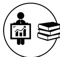
PPS 6 GESTÃO do Projeto e DISSEMINAÇÃO Técnico-Científica