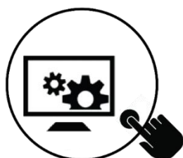
PPS 4 Metodologias e Sistemas DIGITAIS