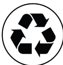
PPS 5 Desafios ECONÓMICOS, SOCIETAIS e AMBIENTAIS