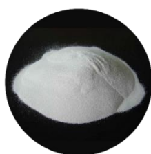
PPS 2 Materiais CERÂMICOS e CIMENTÍCIOS